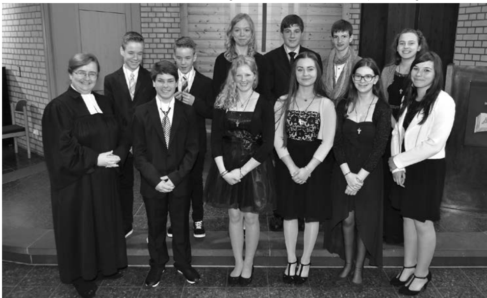
In festlicher Kleidung nach dem Gottesdienst und jetzt total gut drauf.