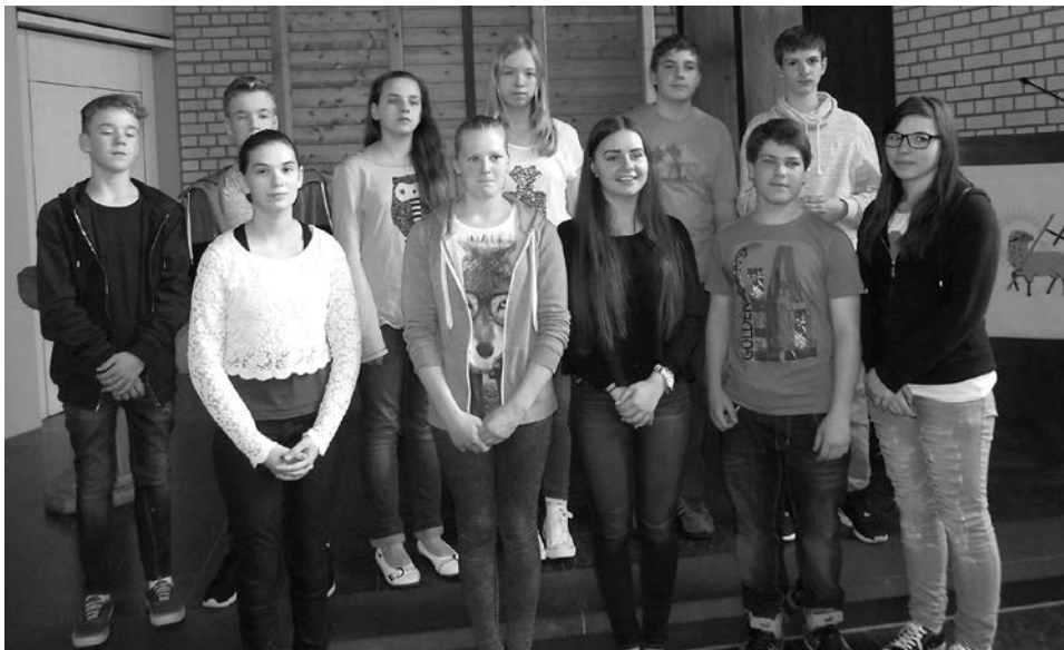
Zwei Tage vor der Konfirmation, in zivil und total angespannt.